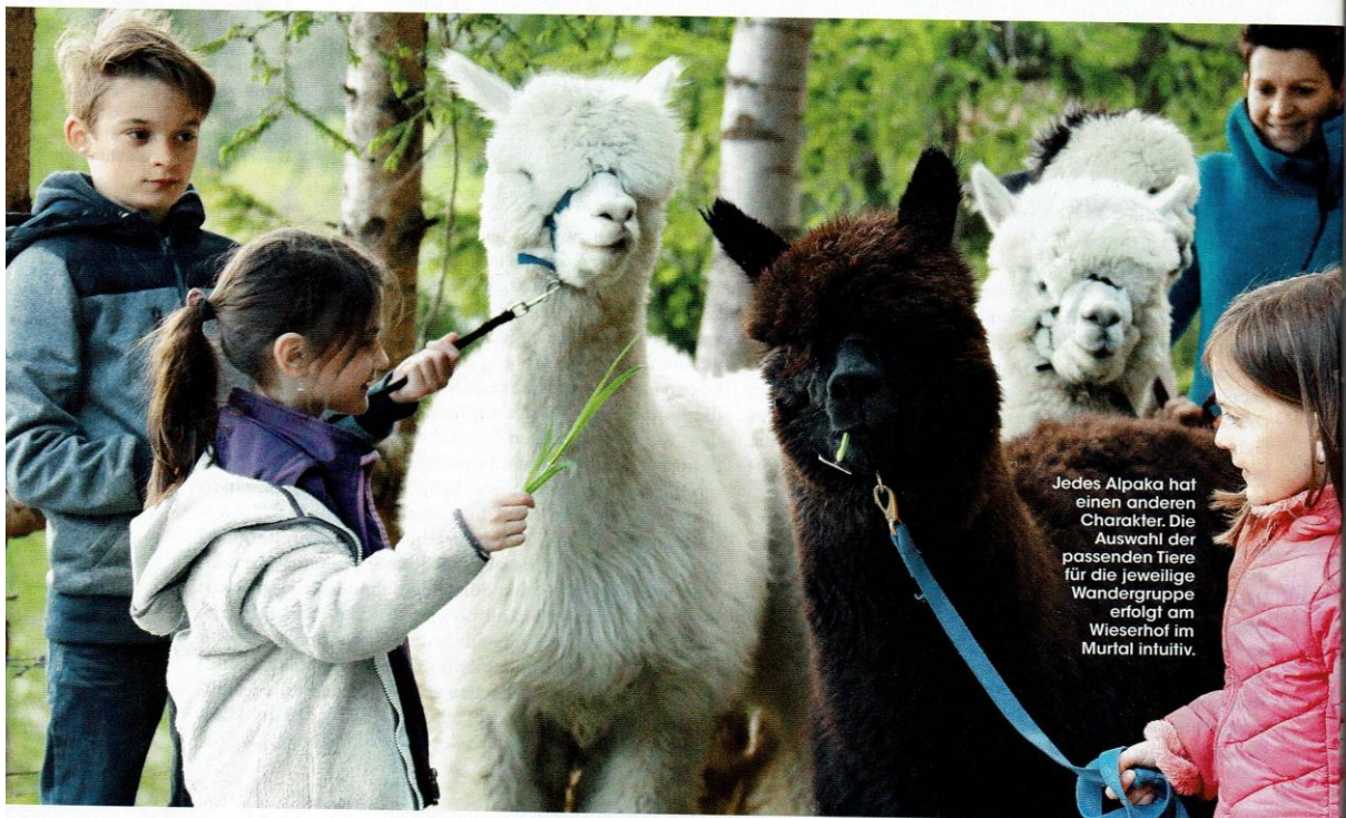
Jedes Alpaka hat einen anderen Charakter. Die Auswahl der passenden Tiere für die jeweilige Wandergruppe erfolgt am Wieserhof im Murtal intuitiv.